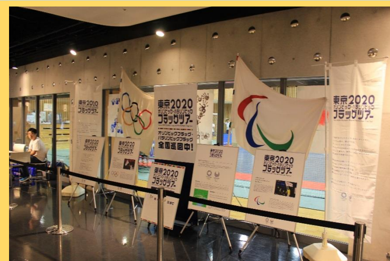
東京2020 オリパラ ブース