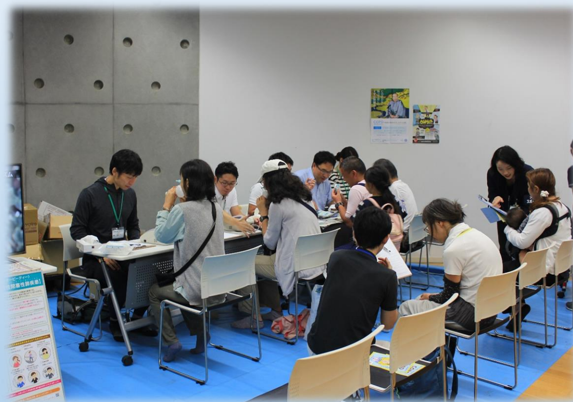
肺年齢・血流量測定