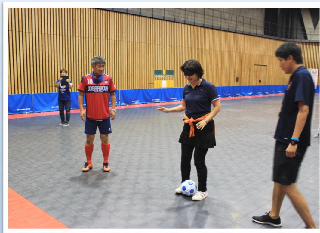
ブラインドサッカー